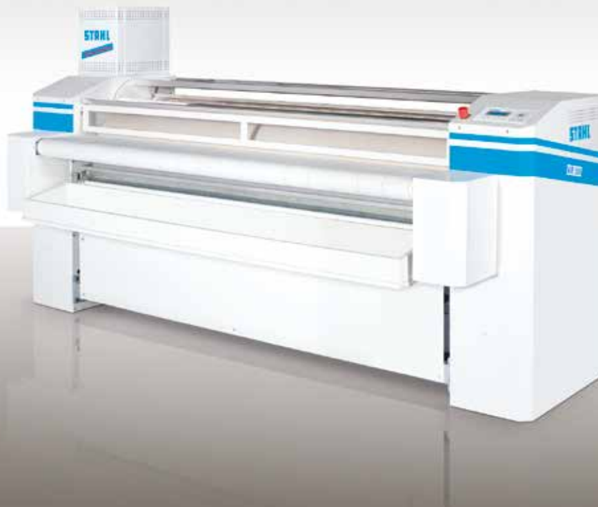
MR 330, 400, 500, 600, 800