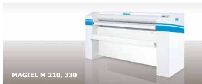
MAGIEL M 210, 330