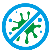
Środki do usuwania plam